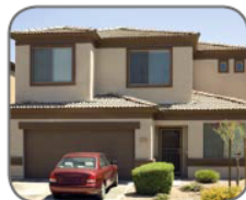
3. Das Auto steht vor / auf / hinter dem Haus.