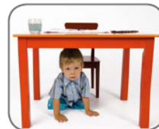
4. Das Kind sitzt auf / unter / hinter dem Tisch.