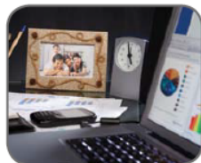
2. Das Foto steht über / an / auf dem Schreibtisch.