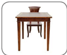
1. Der Stuhl steht an / auf / unter dem Tisch.